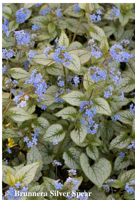
Brunnera Silver Spear