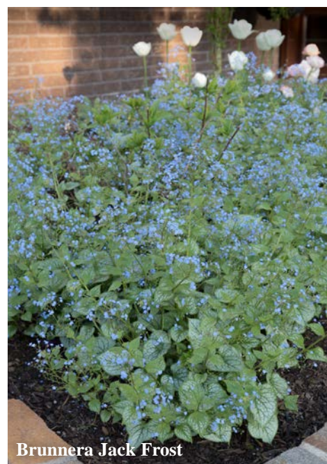
Brunnera Jack Frost