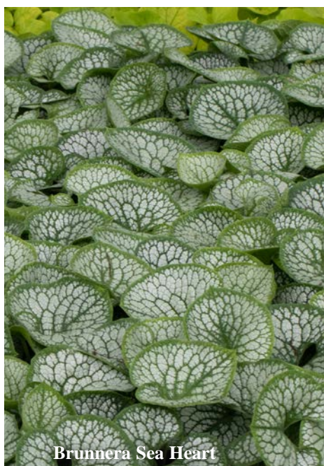
Brunnera Sea Heart