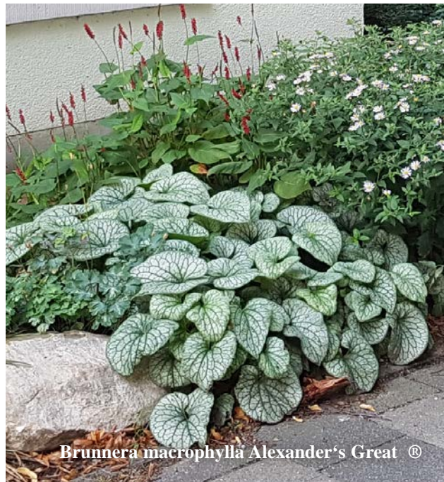
Brunnera macrophylla Alexander's Great ®