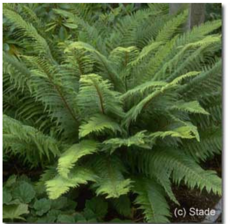
Polystichum setiferum 'Dahlem'

Und dann sind da natürlich diese unglaublichen botanischen Namen, die es allein schon wert sind, einen Gymnocarpium dryopteris unter dem Eichenbaum anzusiedeln oder einen Thelypteris decursivepinnata als Tausendfüßlerimitat in Wassernähe herumkriechen zu lassen. Was meinen Sie, wie ich mich fühle, wenn ich Gartengästen unsere Schildfarne anpreise: „Also bei Polystichum setiferum schwöre ich ja auf ‚Plumosum Densum‘, auch wenn Frau X meint ‚Herrenhausen‘ und Herr Y ‚Proliferum‘ seien da mit ihrem Wintergrün zu bevorzugen.“ Sie können sicher sein, dass irgendein Fa(r)ntastiker ‚Pulcherrimum Bevis‘ besser findet, weil die Spitzen leicht überhängen oder die Sorte ‚Dahlem‘, weil er sich Berlin besonders verbunden fühlt. Und wenn dann noch ein paar Weitgereiste unter den Spezialisten sind, fällt bestimmt die Art ‚tsus-simense‘, die man in Japan im Original gesehen haben will, und die jetzt im eigenen Garten an einer geschützten Stelle im Steingarten stehe. Dann zuck‘ ich mit dem „Wimpernfarn“ ( Woodsia obtusa ) und denke mir, „einer ist so schön wie der andere“. Was hat sich die Natur da Geniales ausgedacht!